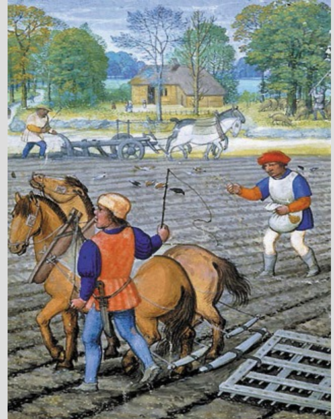
Крестьяне за работой. Средневековая миниатюра

Основа произведения – изображение конфликта между отцом-крестьянином и сыном, который проникся презрением к честной крестьянской жизни и примкнул к рыцарям, живущим разбоем.