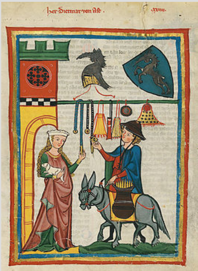
Дитмар фон Айт Манесский кодекс (ок. 1300 г.) Гейдельбергский университет

У поэтов «архаического» стиля встречаются «женские песни», один из жанров «объективной лирики», наиболее распространенных в народной поэзии.