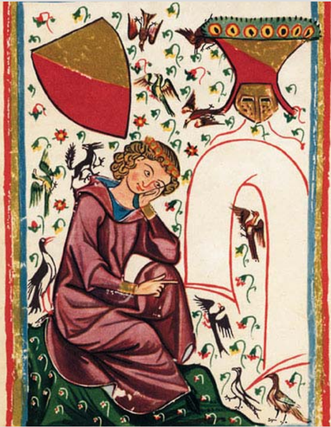
Генрих фон Фельдеке. Миниатюра из «Большого Гейдельбергского рукописного сборника песен» (около 1250 г.). Гейдельбергский университет

Придворное (куртуазное) направление возникает в западных областях Германии, в более передовых прирейнских землях, где распространились пришедшие из Франции идеи и вкусы, и рыцарская поэзия перестроилась по новым французско-провансальским образцам.