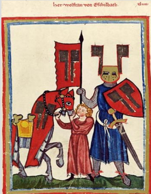
Вольфрам фон Эшенбах Миниатюра из Манесского кодекса (XIV век ).

Вольфрам фон Эшенбах – один из крупнейших эпических поэтов немецкого средневековья.