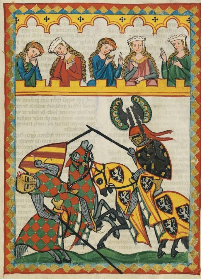
Миниатюра из Манесского кодекса (XIV век ). Гейдельбергский университет