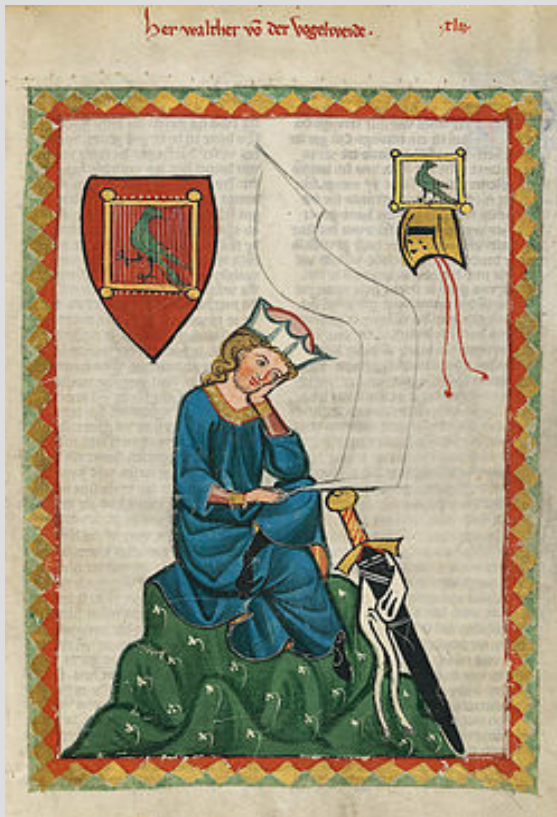
Вальтер фон дер Фогельвейде Манесский кодекс (ок. 1300 г.)