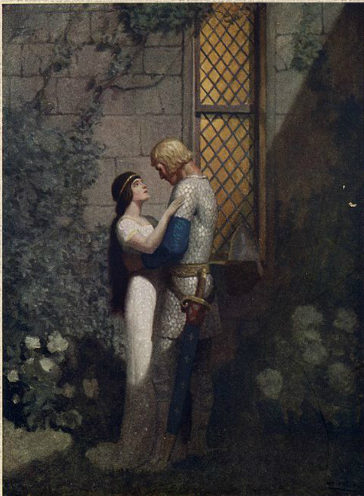
Тристан и Изольда Худ. Ньюэлл Конверс Уайет

Главное произведение Готфрида Страсбургского – роман «Тристан» (около 1210), оставшийся незаконченным.