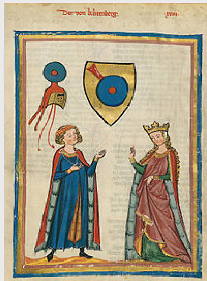
Кюренберг Манесский кодекс (ок. 1300 г.) Гейдельбергский университет

Главные представители – поэты Кюренберг , Дитмар фон Айст и др.