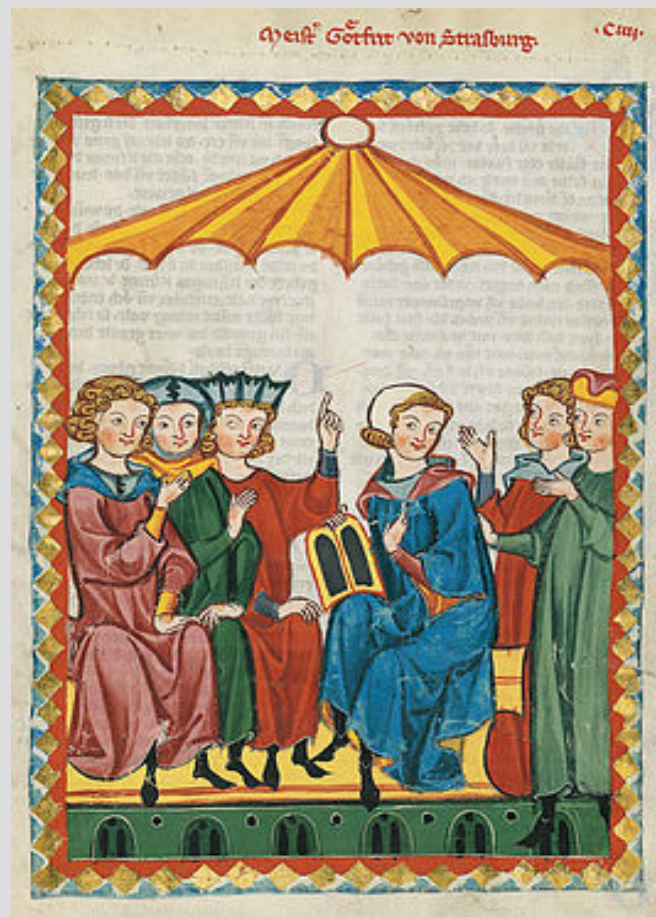
Готфрид Стратбургский Миниатюра из Манесского кодекса (XIV век )