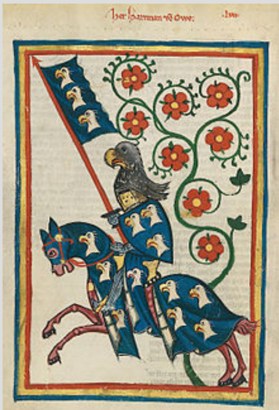
Гартман фон Ауэ Миниатюра из Манесского кодекса (XIV век )

Время создания стихотворной повести – около 1195-го года.